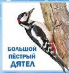
БОЛЬШОЙ ПЁСТРЫЙ ДЯТЕЛ